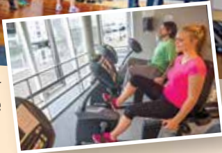
Cardio in maritimer Atmosphäre