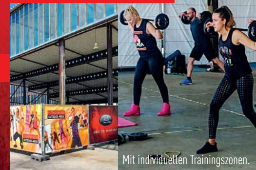
Mit individuellen Trainingszonen.